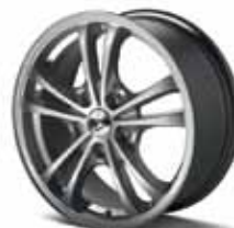
ДЖАНТИ ASTERIA СИВ АЛУМИНИЙ