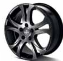
ДЖАНТИ AVANZA СИВ АЛУМИНИЙ CHROME SHADOW*